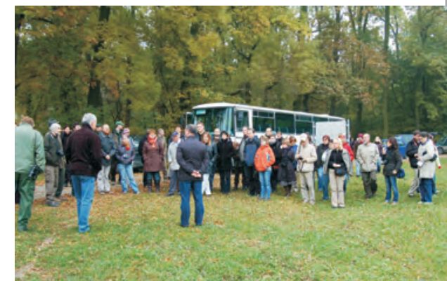
Workshop „Management kulturní krajiny“

Obě akce se konaly pod záštitou ministra zemědělství, pana Ing. Ivana Fuksy, ministra životního prostředí, pana Mgr. Pavla Drobila, ministra kultury pana MUDr. Jiřího Bessera a hejtmana Jihomoravského kraje Mgr. Michala Haška, a za finančního přispění Ministerstva zemědělství ČR, sekce lesního hospodářství a společnosti Lesy České republiky, s. p.