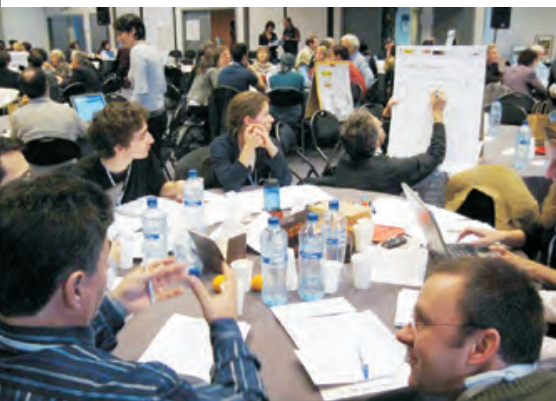
Konference „Pozitivní vize pro biodiverzitu“

Stejně jako v předchozích letech jsme spolupracovali s univerzitami, zejména s Mendelovou univerzitou v Brně.